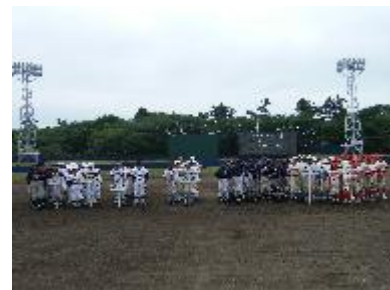
3月30日運動公園の総会開会式で幕を開けた第32回船橋市春季市民野球大会は、5月4日に予定された。