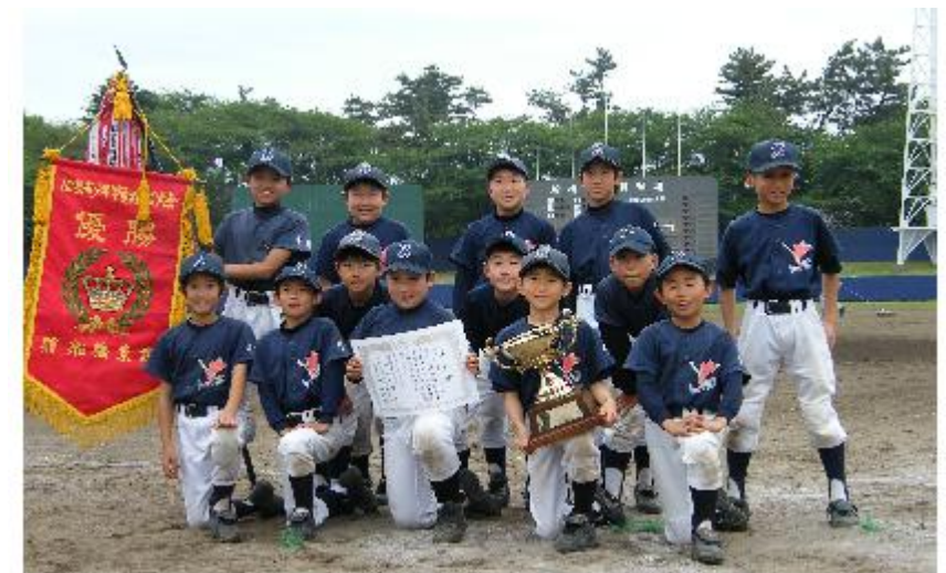
Bリーグ優勝 海神スパローズ

たところは、声を出さないから、そこをれんげいプレーで声をつなぎ声をだすことでした。よかったことはエラーでも、ナイスキヤッチでもその守備を「ナイスプレー」と言って声を掛けたところです。かんとく、コーチの指示に従って、その言ったところをよく聞く。コーチに教えてもらったことを試合に出せるようにする。 一番苦しかった試合は夏見台アタックス戦でした。サドンデスで先に点数を取られたけど、今度はぼくたちがサヨナラ勝ちをしました。その試合を大事にしていきたいと思っています。 優勝できてうれしかったです。